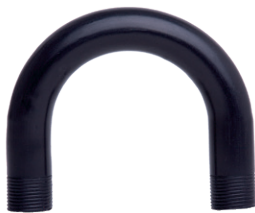
Curva 180° Ø ½" até Ø 2"