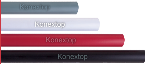
Eletroduto de encaixe colorido Ø 1/2" - 3/4" - 1" Eletroduto com rosca colorido Ø 1 1/4" - 1 1/2" - 2"