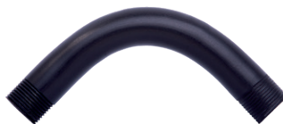
Curva 90° longa Ø ½" até Ø 4"